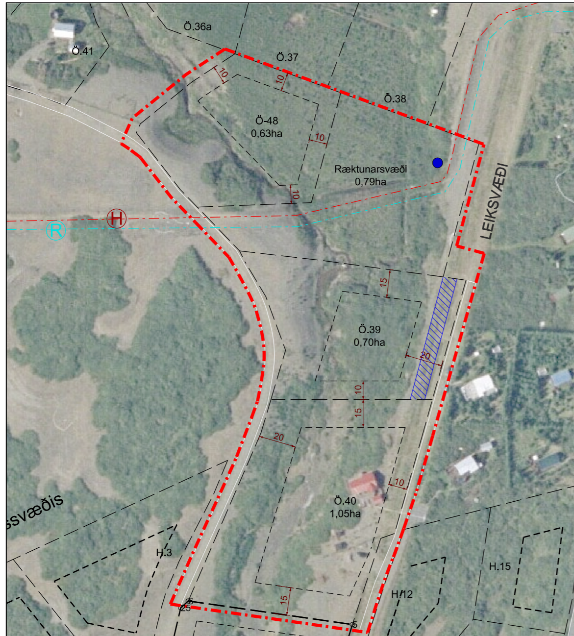
Gildandi deiliskipulag, mkv. 1: 2000 sem var samþykkt 03.10.1995, m.s.br.