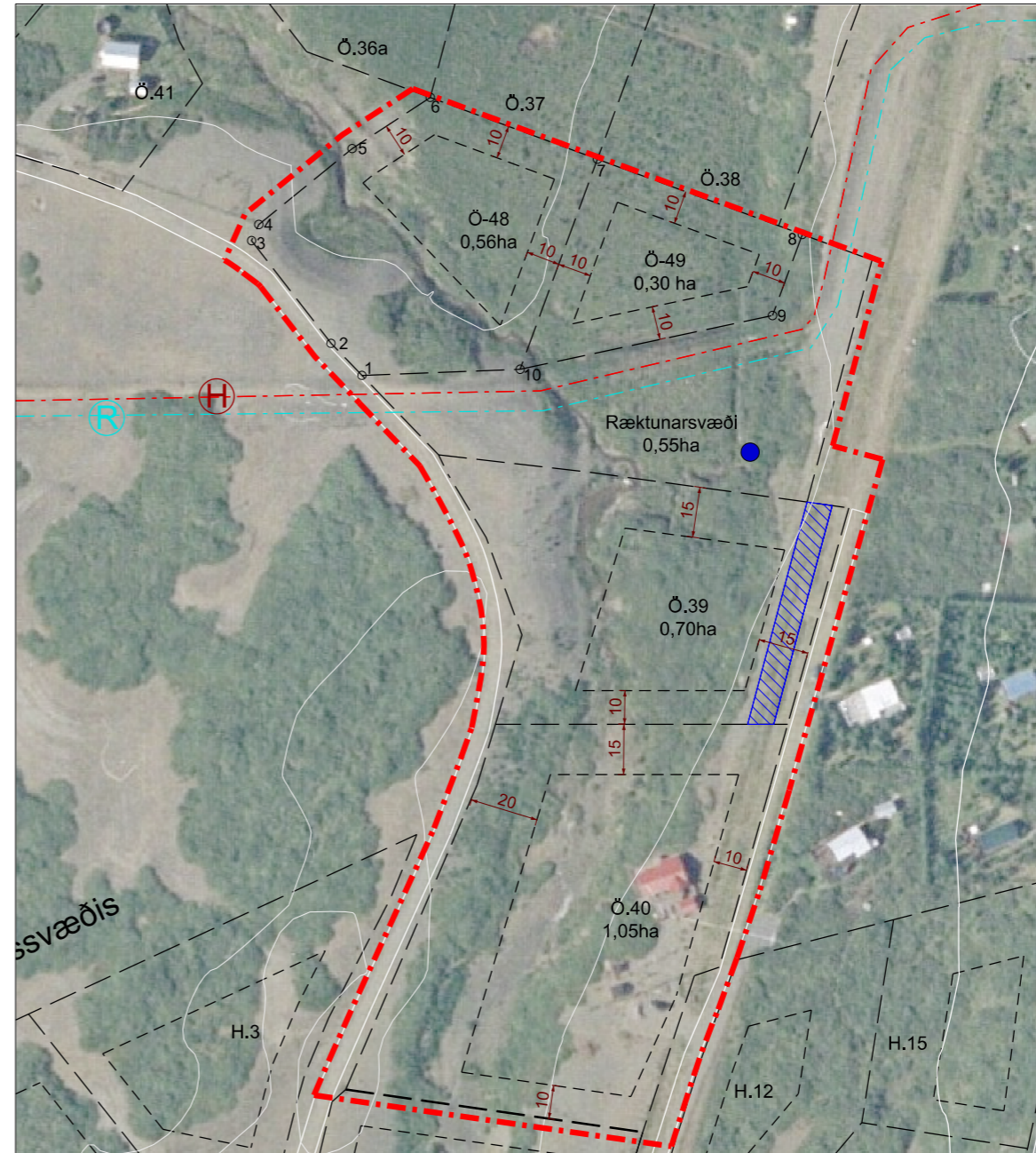
Breytt deiliskipulag, mkv. 1: 2000.