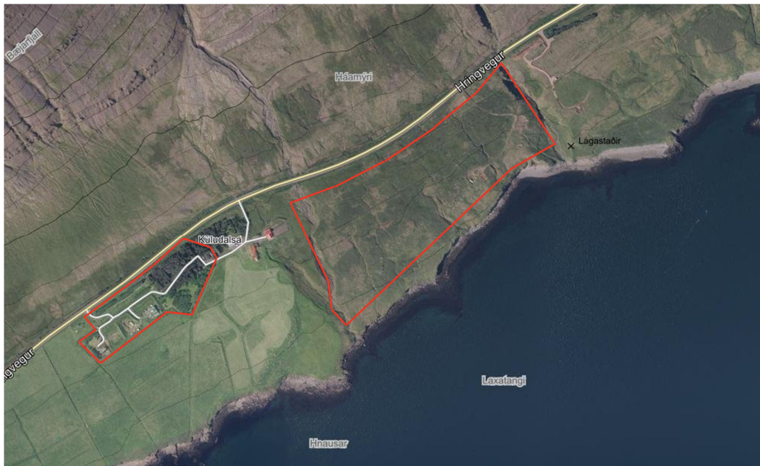
MYND 1. Svæðin sem breytingin nær til eru innan rauðu flákanna

Samanlagt er stærð skipulagssvæðisins er um 23,5 ha.