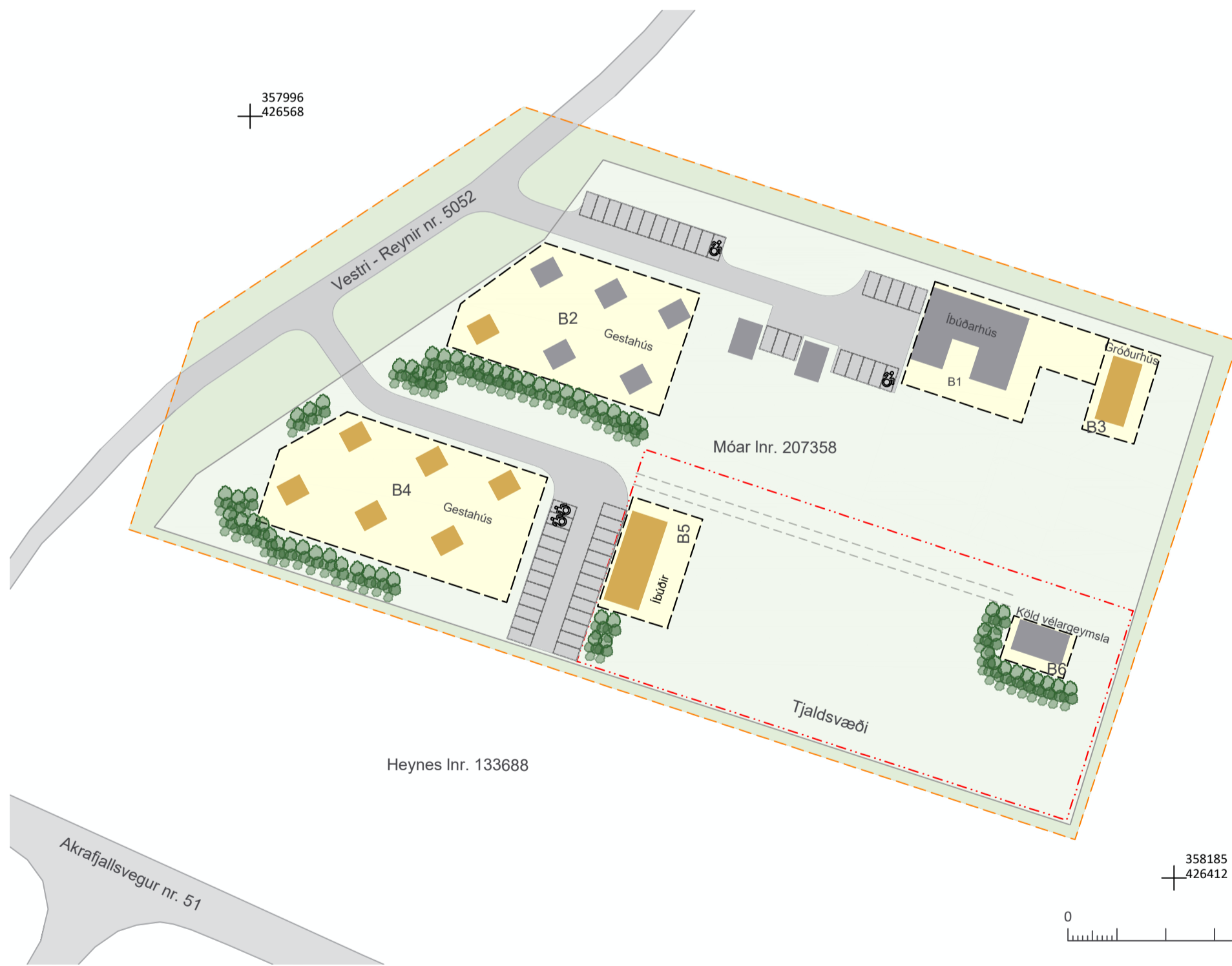
BREYTTUR DEILISKIPULAGSUPPRÁTTUR, MKV. 1:1000